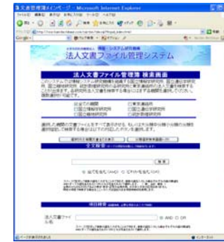
情報システム研究機構