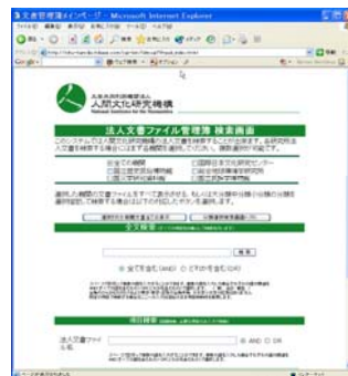
人間文化研究機構